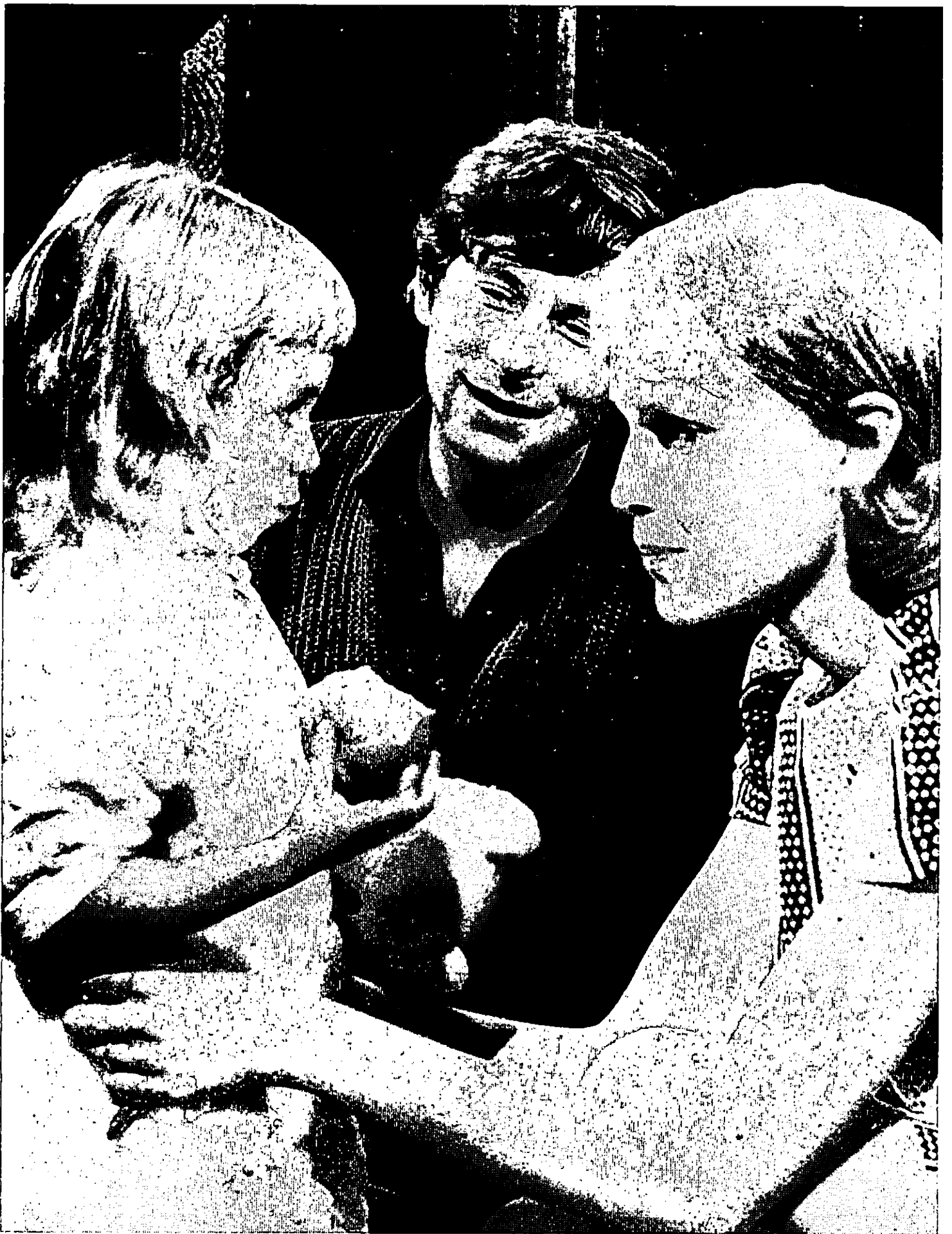
ROMAN POLANSKI ET MIA FARROW PENDANT LE TOURNAGE DE « ROSEMARY'S BABY »